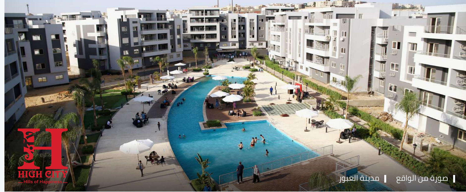
صورة من الواقع | مدينة العبور