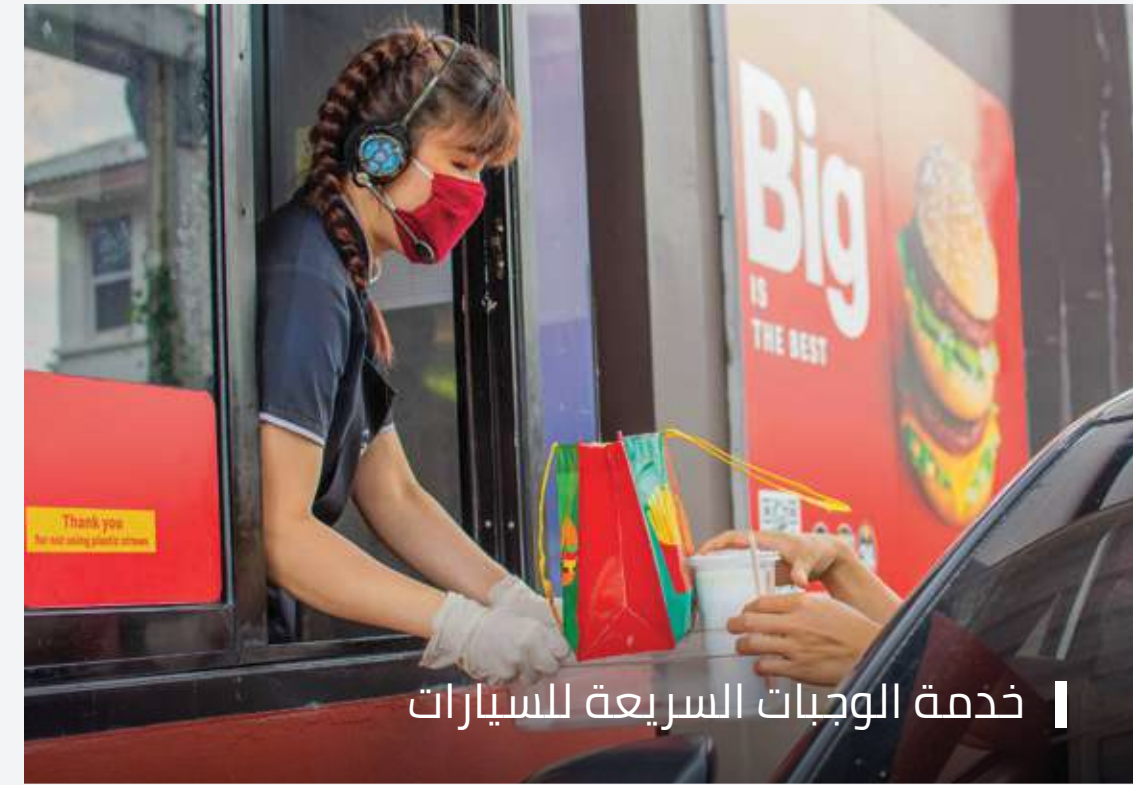
خدمة الوجبات السريعة للسيارات