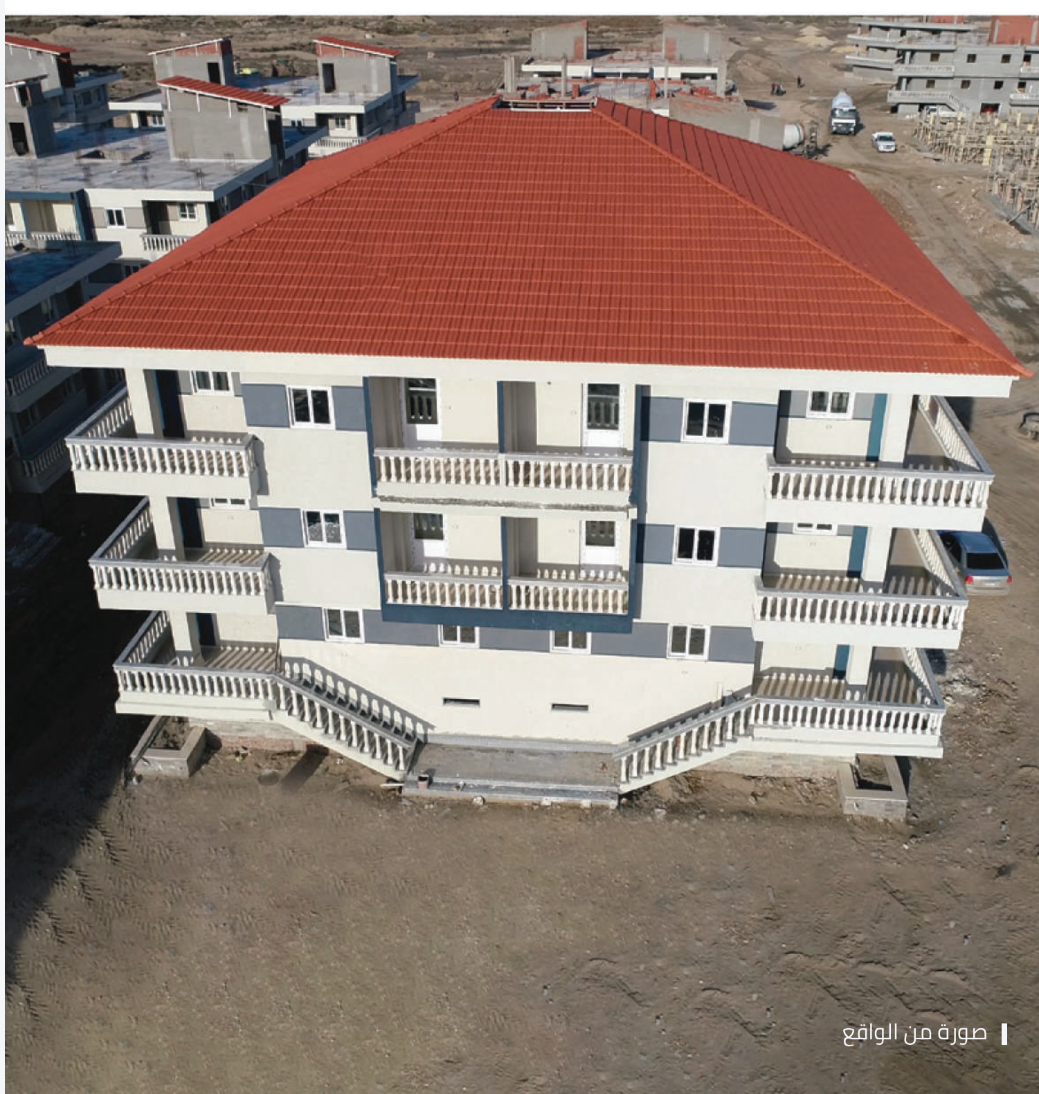
صورة من الواقع