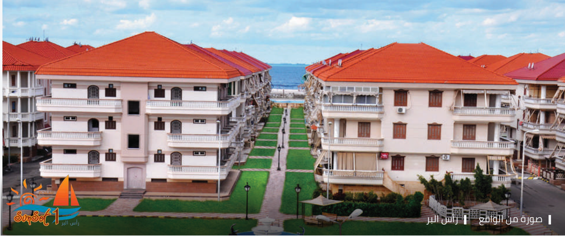
صورة من الواقع | رأس البر