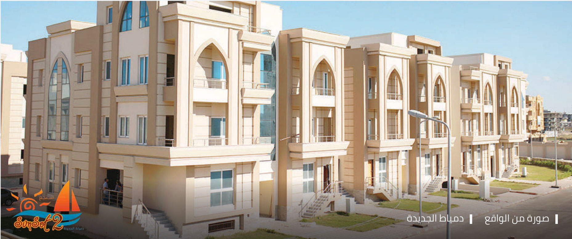
صورة من الواقع | دمياط الجديدة