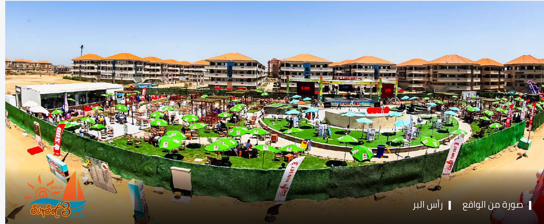
صورة من الواقع | رأس البر